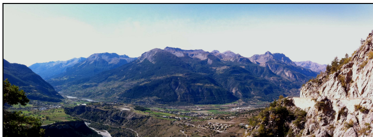
... un peu plus tard, à 15 :00 : les nuages ne s'aventurent pas plus au sud !