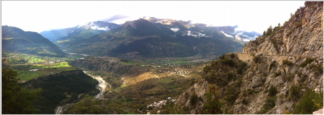
Aperçu des conditions météo en début d'après-midi dans la vallée de la Durance au niveau de MontDauphin.

L'aigle royal est vu sur tous les postes. A Réotier, 10 vautours achèvent de consommer le cadavre d'une brebis.