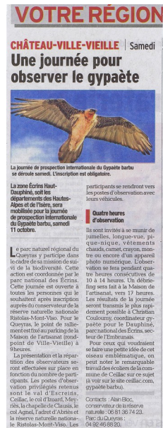
Article de presse dans le Dauphiné libéré