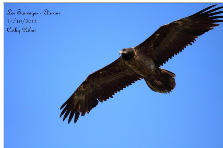
. © Cathy Ribot

La vallée du Ferrand, sur la commune de Clavans-en-Haut-Oisans reste un haut lieu du séjour estival des charognards dans la région : vautours et gypaètes sont présents en permanence. Le jour du comptage, 2 jindividus, Un adulte et un juvénile sont observés (voir photos).