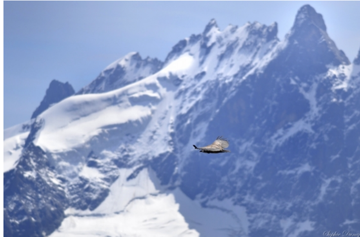
Le 14 août 2013, quelques jours avant le comptage, sur le site des Quirliès.

Malgré des situations locales variées, les conditions météorologiques ont permis la mise en oeuvre de l'opération. 90 observateurs se sont mobilisés sur les 23 postes répartis sur les massifs prospectés.