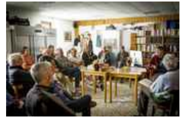
Une assemblée studieuse, recueillie, conquise, volontaire, bénévole et ... affamée !