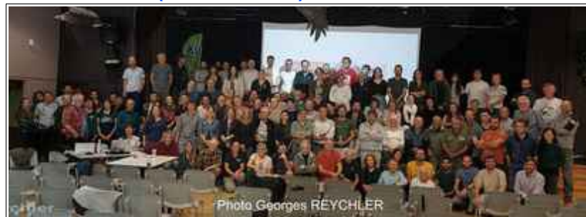
Les participants aux rencontres vautours 2024 à Val Cenis