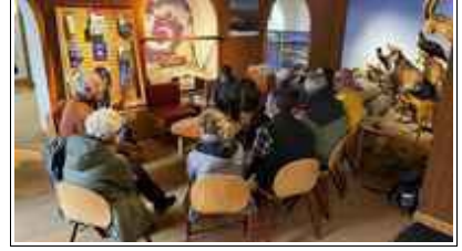
Le « plan B » : échanges dans le Centre d'informations du Parc national des Ecrins