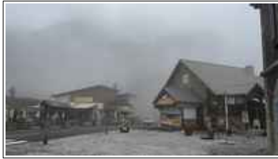
Des conditions météo très défavorables