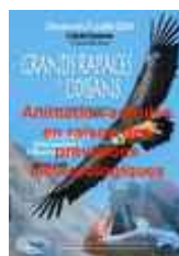
L'animation sera annulée en raison de la météo