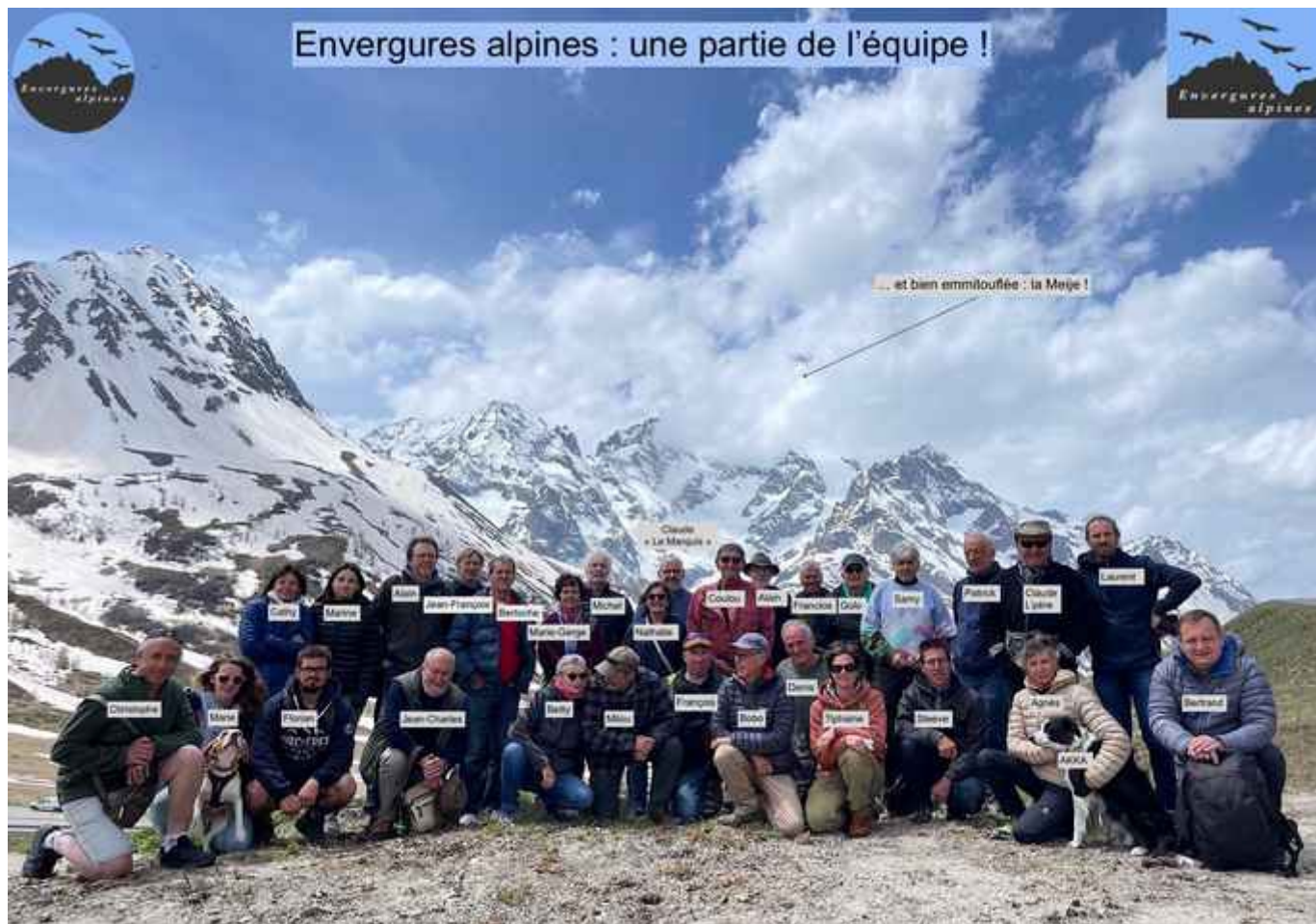
Les membres adhérents présents pour l'Assemblée générale au col du Lautaret le 22 mai 2024

C'est au Café de la Ferme (Villar d'Arène) que nous nous sommes réunis pour cette AG 2024.