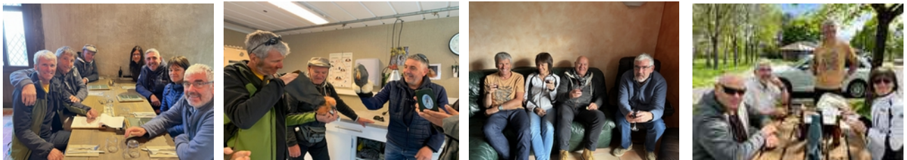
Ambiance conviviale à l'image de l'esprit de l'association

L'occasion pour toute l'équipe de remercier vivement la VCF pour son écoute et sa confiance.