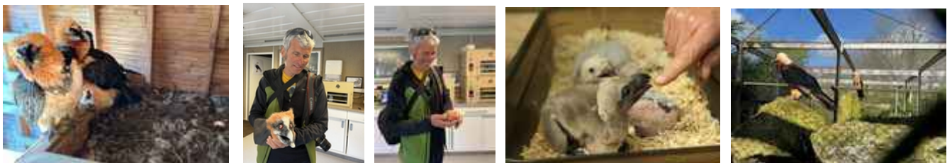
Dans les coulisses de l'élevage des rapaces