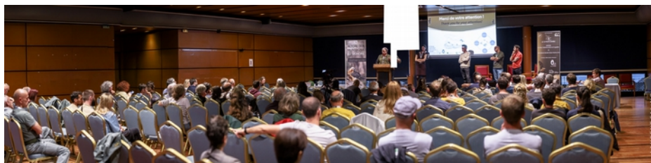
L'assemblée dans le Palais des Congrès à Ajaccio

Quelques photos des personnalités qui gèrent le projet à l'international (IBM et VCF).