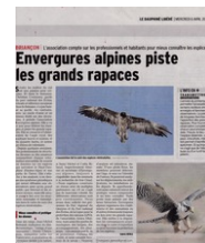
Le Dauphiné parle de nous !

Instruction de la déclaration officielle de l'association