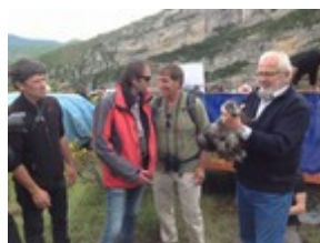
Pour quelques secondes, les oiseaux sont confiés aux personnalités locales