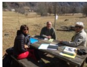
Rencontres du bureau (24/03/2016 & 21/03/2017)