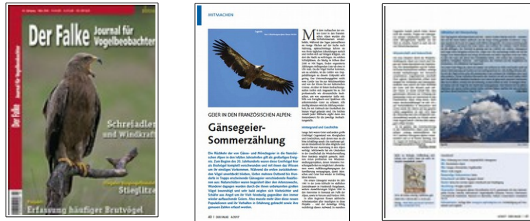
Couverture d'un numéro précédent et maquette de l'article à paraître

Der Falke : Rédaction d'un article sur les comptages vautours au dortoir à la demande d'un magazine allemand « Der Falke ». Merci à Jean-Luc Pinel pour la traduction français > anglais !