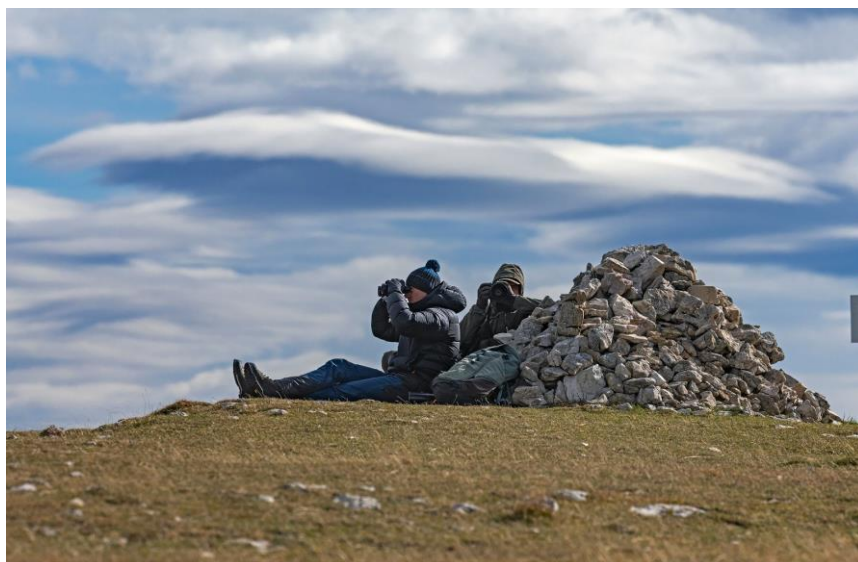
Observateurs dans le Vercors