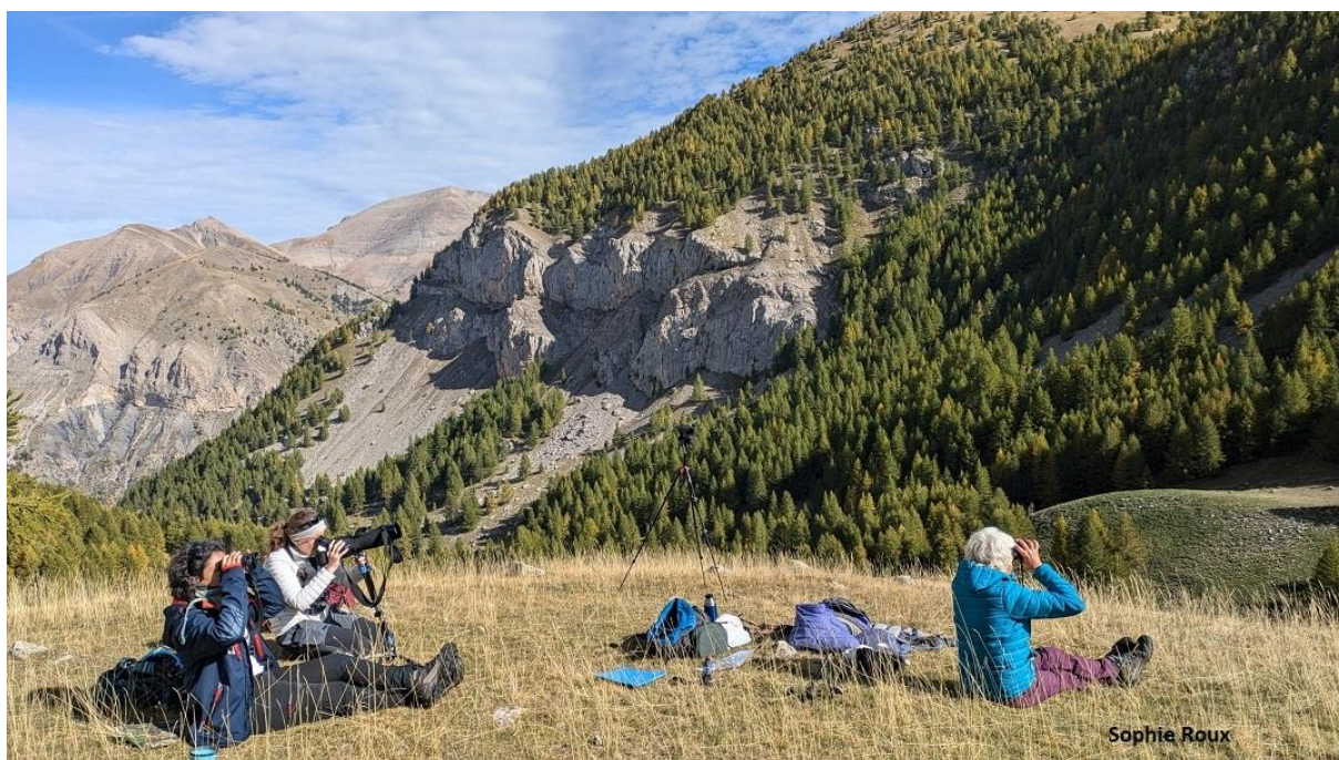
Poste d'observation dans le Haut-Verdon