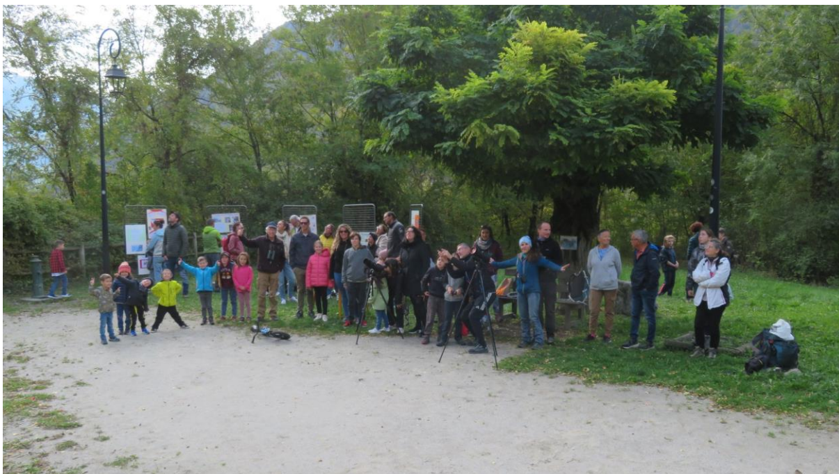
Poste grand public tenu par une équipe de bénévoles à Saint-Julien Montdenis

Kobalann a été photographié à plusieurs reprises en Haute-Maurienne. C'est une femelle lâchée dans le Vercors en 2020.