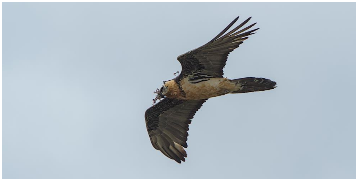
Transport de matériaux versant Nord du massif du Bargy

Plusieurs individus adultes ou subadultes ont été contactés par les postes se situant entre les territoires de reproduction (Sales, Dérochoir, Lachat d'en haut, Chalets de Varan...).