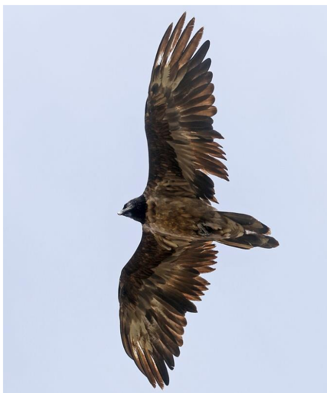
Individu immature de type 3ème année