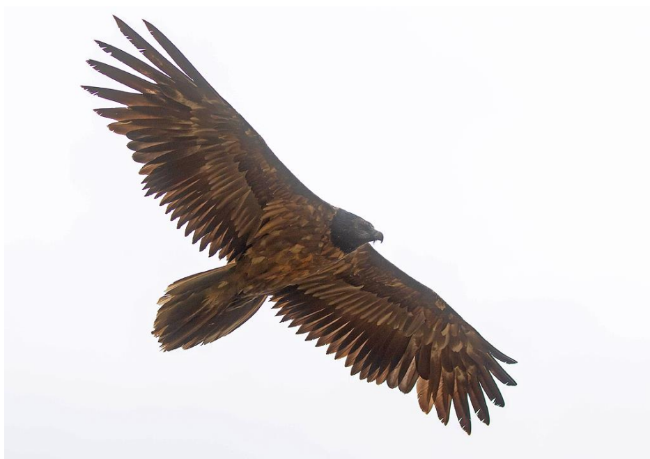
Individu immature de type 2ème année

Un dernier immature a été vu en Haute Tarentaise au col du petit Saint-Bernard arrivant du côté Italien.