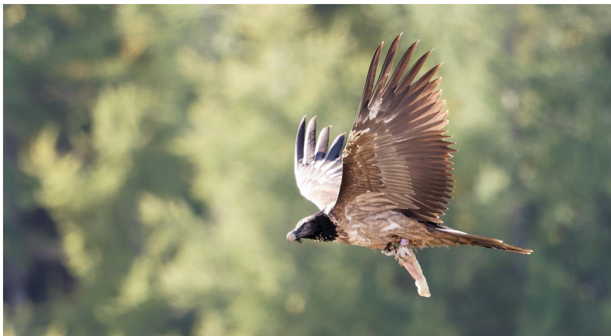
Alpi transportant de la nourriture

Un quatrième individu de cette classe d'âge a également été observé en Tinée et dans le Haut-Var en présence de Roche Grande en fin de prospection.