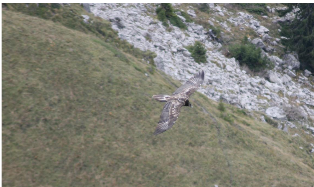
Probablement Fortiche, observé depuis la Pointe de Chalune (Roc d'Enfer)

Genep , né au Sud du Bargy a possiblement été vu depuis le poste de la Vierge du Châtelard (données GPS), cependant un sixième individu de cette classe d'âge n'a pas été comptabilisé car le risque de double comptage n'est pas exclu.