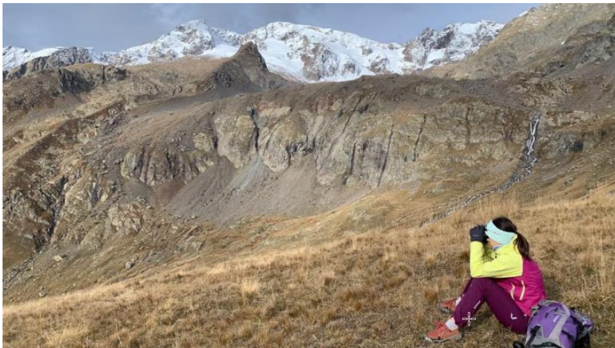
Le vallon du Ferrand, « hot spot » du comptage 2024 en Haut-Dauphiné