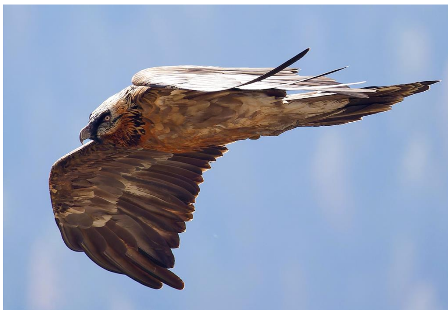
Kobalann photographié en Haute-Maurienne

Pierro qui a transité des Bauges au Beaufortin dans la journée n'a pas été contacté (données GPS).