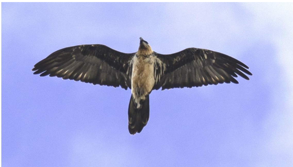
Adulte imparfait en Ubaye

Deux individus présentant un plumage d'adultes imparfaits ont été contactés.